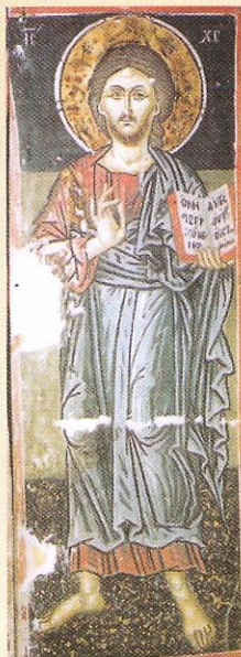
Τοιχογραφίες στο Νάρθηκα

Ἐπῆρξε σημαντικό ἐκκλησιαστικό κέντρο καί διατηροῦσε στενοὺς δεσμούς μέ τό Φανάρι καί τό Ἅγιον Ὅρος καθὼς καί μέ τή Ρωσία, ὅπου συντηροῦσε μετόχι τό ὁποῖο καί προσέδωσε στό Μοναστήρι τήν ἐπωνυμία «το Ρωσικόν».