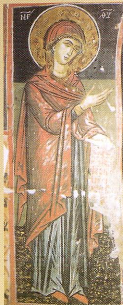
Τοιχογραφίες στο Νάρθηκα

Τό Μοναστήρι τῆς Κοιμήσεως τῆς Θεοτόκου Ρεντίνας εἶναι κτισμένο σε πλαγιά τῶν Ἀγράφων στήν Πίνδο, στή συμβολή τῶν νομῶν Καρδίτσας, Φθιώτιδας καί Εὐρυτανίας. Ἀπέχει 7 χλμ. ἀπό τό χωριό Ρεντίνα, ἔδρα τοῦ ὁμώνυμου Δήμου καί σέ παλαιότερες ἐποχές ἔδρα τῆς Ἐπισκοπῆς Λιτῆς καί Ρενδίνης.